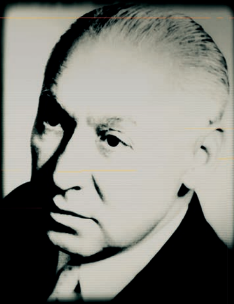
神經精神病學家，拉迪斯勞斯·馮·梅杜納