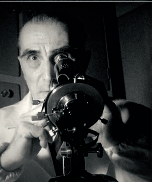
電擊療法之父，烏果·瑟雷悌